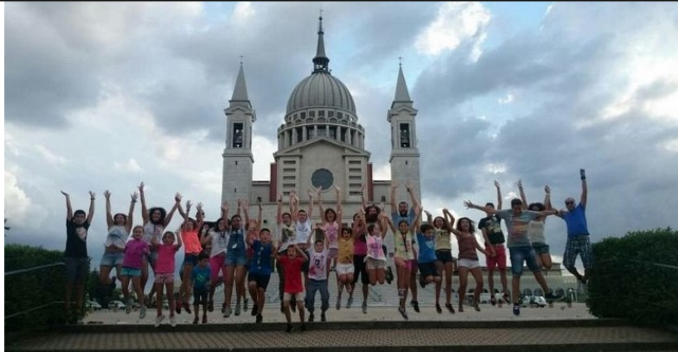
Like, with, for