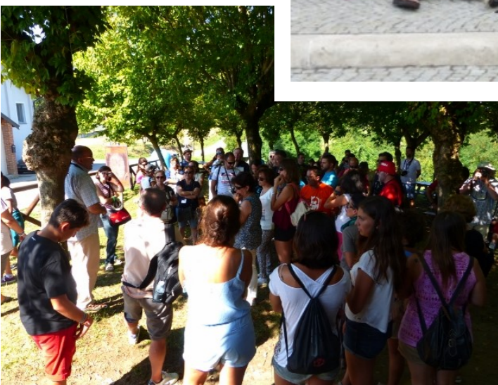
Los guías de la peregrinación, motivando a los asistentes mientras visitaban los lugares de origen de Santo Domingo Savio

(En la página anterior, con el Rector mayor, en Valdocco)