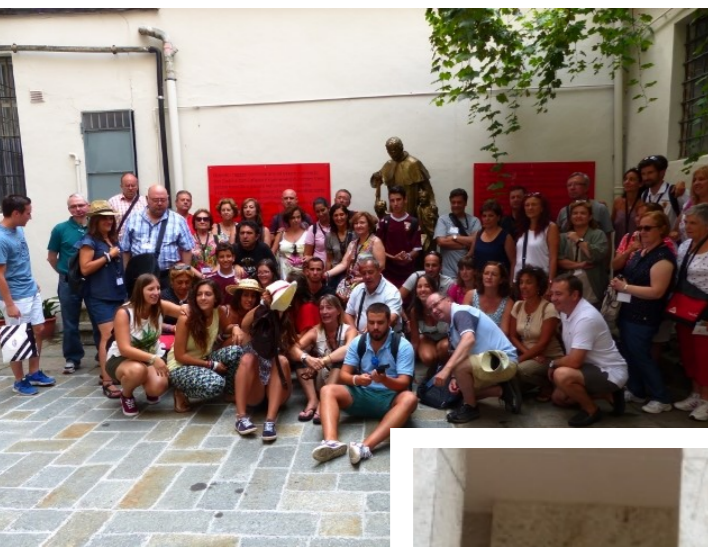
Un grupo de peregrinos a la salida de la sacristía de la iglesia de San Francisco de Asís, en Turín.