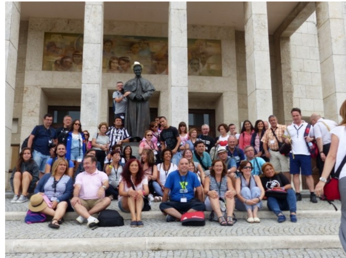
Salesianos Cooperadores de la Provincia de Madrid a la entrada de la Basílica del Colle Don Bosco y con el Rector Mayor

(En la página anterior, con el Rector mayor, en Valdocco)