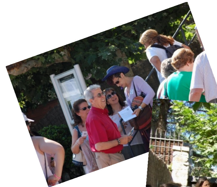
Diferentes momentos de la primera parte del día: un recorrido cultural (y gastronómico) por Manzanares el Real.

Desde el primer momento, el grupo de guías se afanó en desvelarnos los misterios del castillo y su entorno. Para todos fue un agradable encuentro después de un curso repleto de actividades. Para nuestros hermanos de Soto, además, una oportunidad de mostrarse, como siempre, amables, cercanos y acogedores.