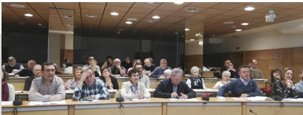
Una panorámica general de los participantes en el Congreso.