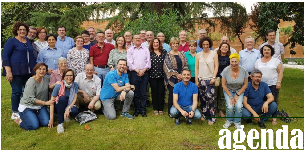
Foto de FAMILIA: la Consulta Regional, que se celebró entre los días 8 y 9 de junio, posan para nuestro Boletín en un descanso de su trabajo. Unidos en la misión y en el Carisma.