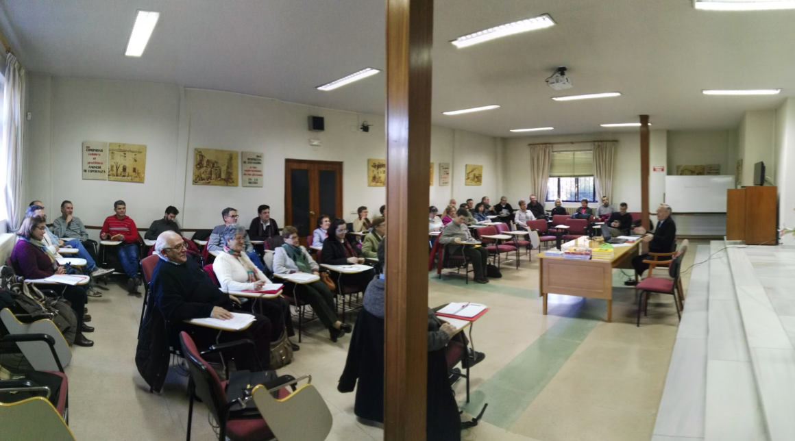
La asamblea durante los momentos de estudio y comentario del Aguinaldo.